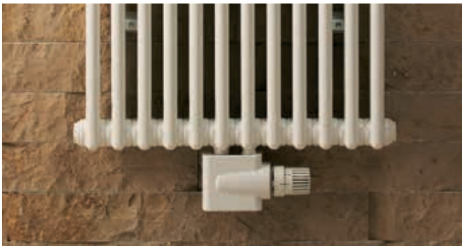
Anschluss-Armatur Zehnder Vario